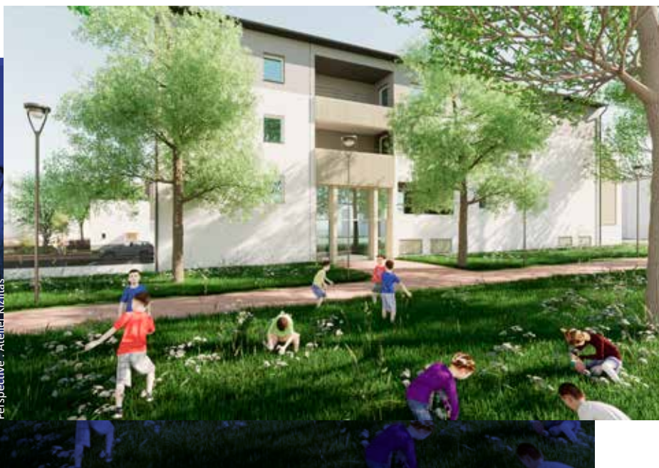
Perspective : Atelier Kiziltas

Alors que les travaux battent leur plein au sein de ce nouveau quartier aménagé par assemblia, un partenariat a été cosigné, avec CICO Promotion. Le but est de construire, puis louer ou vendre, des logements privés, en totale indépendance des logements locatifs sociaux. Pour cette première, ce sera une vingtaine de logements en accession libre au sein LA 48. Ce type de partenariat sera certainement une action que nous reproduirons pour la mise en œuvre d'autres projets en co-promotion, afin de permettre à assemblia d'élargir ses offres !