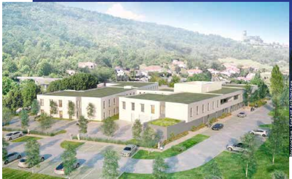
Perspective : Sextant Architecture

La commune de Volvic, souhaitant construire un nouvel Ehpad, a retenu assemblia pour l'accompagner. Le suivi de chantier, le pilotage administratif, financier et juridique du projet ont été nos missions. Le personnel de l'Ehpad a été associé à l'élaboration des futurs locaux. Une attention particulière a été portée sur les espaces communs intérieurs et extérieurs, pour faire en sorte que les résidents soient à la fois en : sécurité, sans avoir un sentiment d'enfermement. Le bâtiment prend place sur un site particulièrement qualitatif, avec la majorité des terrasses et jardins orientés sur le Château de Tournoël et ses coteaux environnants. L'objectif a été de contribuer à l'amélioration du cadre de vie des résidents et des conditions de travail du personnel du futur Ehpad.