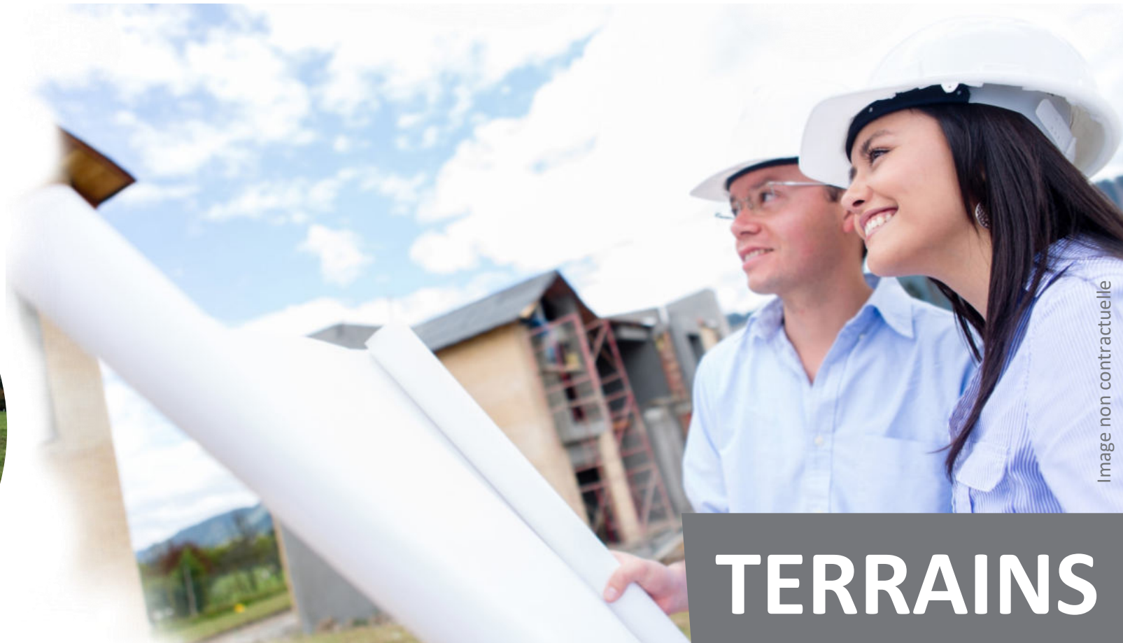
Image non contractuelle